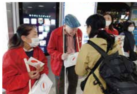
練馬駅での街頭募金の様子

共同募金は、地域でともに暮らす人たちのために役立ててほしいという思いが込められた寄付金です。民間福祉施設の環境支援、子育て支援、障害者の自立支援のための事業のほか、私たち練馬区の地域福祉を推進していく事業費として配分されます。町会・自治会、民生・児童委員の方や商店街など、たくさんの方々にご協力いただきました。また、今年度は地域の方々にもご参加いただき街頭募金を実施することができました。