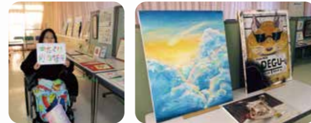
(向かって左)かたくりから企業に就職した人の花文字や、(向かって右)交流のある大泉桜高校の美術部の作品も展示していただきました

またこのような機会を設け、地域のみなさまと交流をしながら、『KATAKURI ART』の作品を知っていただけるように取り組んでいこうと考えています。