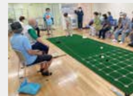
囲碁ボール プレイ中の様子

囲碁ボールは、ゲートボールとオセロゲームを掛け合わせた、老若男女・児童・障害のある人に楽しく喜んでいただける手軽なスポーツです。また、手足の動作や戦略性でも脳を働かせる事で、フレイル予防にも役立ちます。今回用具一式を購入でき、みなさまのイベントや各施設の事業等に参加しやすい環境が整いました。多くの参加者に喜んでいただけるよう、より一層まい進いたします。