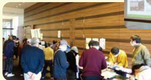
福祉作業所のオリジナルグッズ販売会