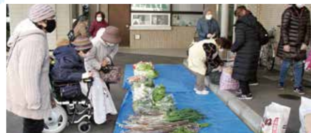
農家さんから譲り受けた野菜も販売しています

みんなの家は、光が丘2丁目の地域を中心に子ども食堂やフードバンクを行うグループです。子どもの貧困やひとり親家庭、ひとり暮らしの大人が増えていることをきっかけに、子どもが健やかに育ってほしい、食を通して生きる力を持ってほしい、顔見知りを作ってほしいという思いから始まりました。