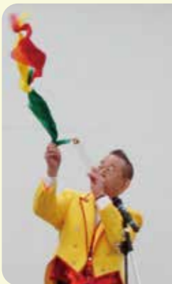
おしゃべりマジックショー