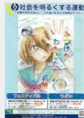
ポスターは毎年公募を行っています

練馬区保護司会は法務大臣により委嘱された保護司で構成され、犯罪や非行をした人の立ち直りを助けるとともに、犯罪予防の活動に取り組んでいる更生保護のボランティア団体です。『社会を明るくする運動』は、犯罪や非行のない安全で安心な明るい地域社会を築くための全国的な運動です。