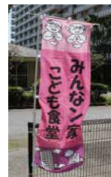
ピンクの旗がトレードマークです

毎月第4土曜日に、同じ地域にある光が丘福祉園をお借りして、『みんなでごはん』と『おたのしみ会(季節の行事)』を開催しています。『みんなでごはん』では、スタッフやボランティアが作ったおいしいごはんを、みんなで「いただきます」をして食べています。子どもや保護者だけでなく、地域に住む大人も