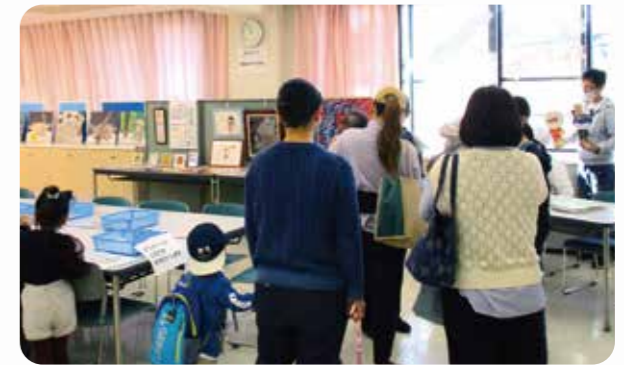
たくさんの方の地域の人にご来所いただきました

12月9日(土)に『大泉☆かたくりギャラリー』を開催しました。このギャラリーは地域講座の一環で、かたくり福祉作業所を知ってもらうとともに、地域との交流を図ることも目的としています。作業として取り組んでいる『KATAKURI ART』の作品と近隣の学校や施設、ボランティアのみなさまの作品も展示することができました。改めて、かたくり福祉作業所