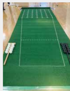
囲碁ボールセット一式

練馬囲碁ボール普及会は、練馬区内の高齢者の『健康長寿・見守り活動・人との繋がり・フレイル認知症予防・居場所づくり』の一環として、新しいスポーツ活動を提供する団体です。囲碁ボールをきっかけに「外出したい、楽しく身体を動かしたい」と感じてもらえるようにと日々活動されています。