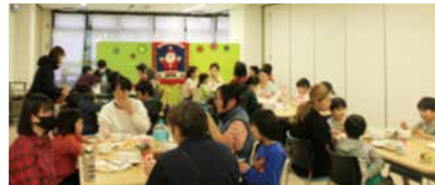
みんなで食べるおいしいごはん

食事やおしゃべり、フードバンクでのかわりなどを通じて、互いに支え合い安心できる居場所にもなっています。