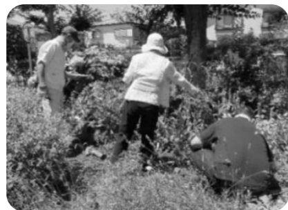
作業を行う“Time”のメンバー

土づくりに米ぬかを使ったり、腐葉土を作ったり。地球環境を考える機会にもなりますよ。