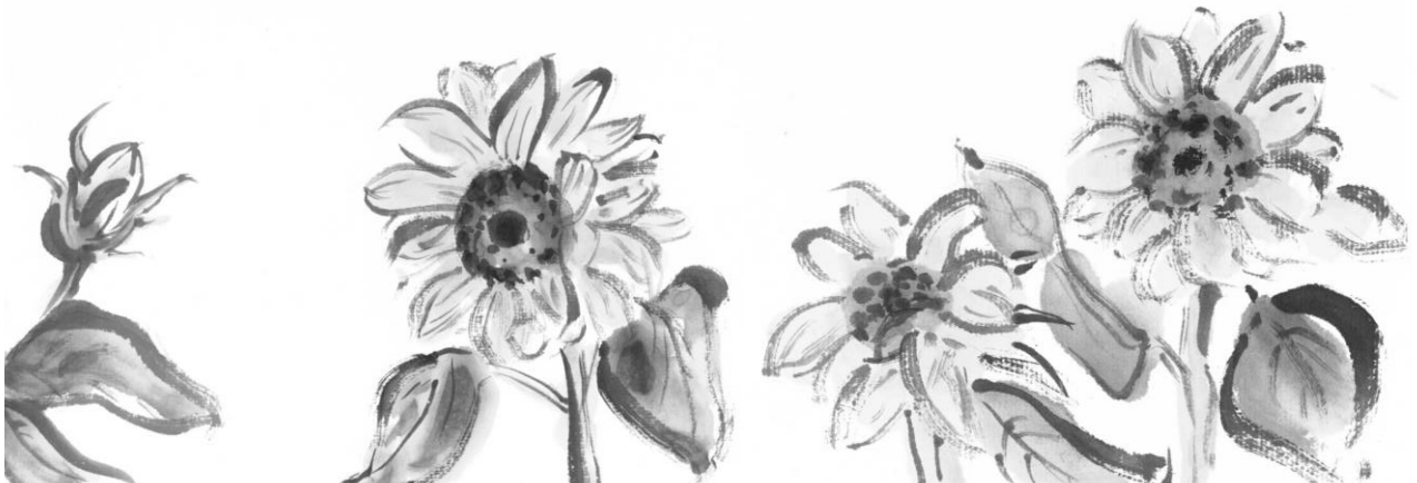
▲ 8月のイラスト：ボランティアのOさんが描いてくださいました。

今回の特集は、福祉施設やその他の公共施設などで活躍する「園芸ボランティア」。ガーデニングを楽しみながら地域とゆるやかにつながることができ、環境を考えるきっかけにもなる活動をご紹介します。