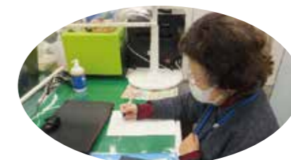
訪問の報告書を記入する生活支援員

利用者の支援で、迷ったり分からないことがあってもセンター内で相談できるので不安はありません。また、生活支援員の研修や交流会も充実していて、新しいことを知り学ぶことができ新鮮です。何かあれば後には練馬区社協がいてくれるのも心強いです。難しさを感じる時もありますが、やりがいの方が大きいです。