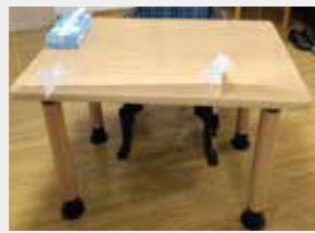
昇降式テーブル導入によりレイアウトの幅が広がります

今回テーブルを購入できたことで、利用者様がそれぞれに合った適切な高さのテーブルで姿勢良く食事を召し上がることができるようになりました。適度な距離を保つことができ、過ごしやすい空間作りができました。この度は本当にありがとうございました。大切に使用させていただきます。