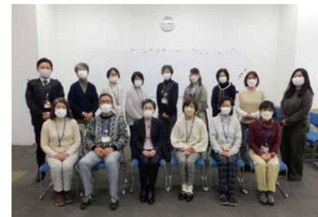
生活支援員研修～講師を囲んで～

練馬区社会福祉協議会の各部署の事業活動をみなさんにわかりやすくご紹介する新コーナーです。