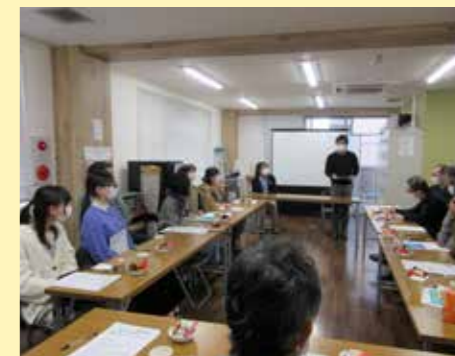
学習会のあとの座談会の様子

社会福祉法人等みなさまが手を取り合い、地域課題等に対していろいろなアイデアを出し合いながら、できることを一緒に考え、様々な取り組みにつながっています。これからも各地区の特徴を活かしながら、取り組みを進めていきます。