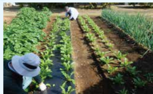
大泉こぐれファームの様子

大泉地区では畑や緑の多い特徴を活かして「大泉こぐれファーム」における取り組みを実施しています。社会福祉法人東京雄心会こぐれの里の一角にてネギや大根、カブなどの栽培、収穫を行い、収穫した野菜を地域のフードバンクや子ども食堂などにお渡ししています。この他にも大泉法人ネットのつながりで就労体験の取り組みを進めています。