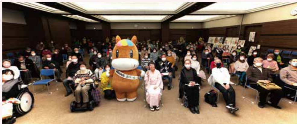
楽しい雰囲気があふれる中での1枚