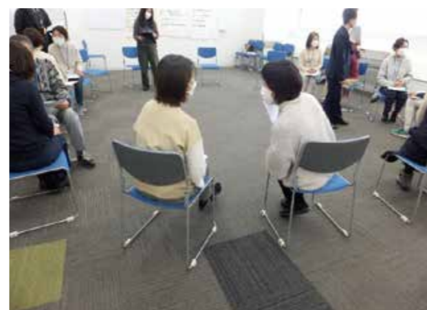
生活支援員～対人援助研修の1コマ～

現在、担当しているのは5名で、利用者の年齢や障害などは様々です。訪問頻度は、だいたい2週間に1回の訪問が多いです。お一人おひとりに合わせた頻度や回数でお手伝いに伺っています。