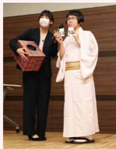
お楽しみ抽選会の様子