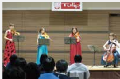
みんなで楽しむファミリーコンサートでの四重奏の演奏

日本ダウン症協会東京練馬支部ちゅうりっぷの会は、ダウン症候群児・者の療育の充実、ならびに地域社会環境の充実、会員相互の親睦を目的として活動しています。「ちゅうりっぷの日」には赤ちゃんと親御さんとの懇談会、ダンス講習会、リズムアンダンテ(音楽療法)等の活動を行っています。