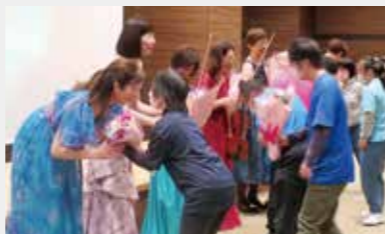
花束を渡しお礼を伝えました

会場のみなさまと共に、楽しいひと時を過ごしました。「心温まる、素敵なコンサートでした」との感想もいただきました。募金して下さったみなさまに感謝申し上げます。本当にありがとうございました。