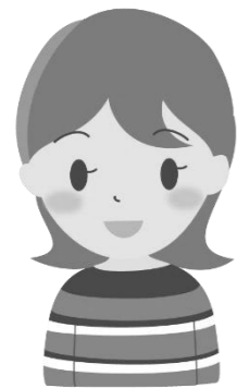
第1回から参加の Sさん

えるでいには専門家がいるわけではないし、参加してもすぐに解決できることばかりではありません。でも毎月顔を出しているうちに、「一人ではない」と気付けるんです。一人では情報を調べるのが大変で、心が折れそうになるけれど、えるでいなら同じ練馬の中で起きている具体的な情報を得ることもできます。