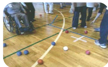
ボッチャ交流会の様子

ボッチャは障害のある方のリハビリやレクリエーションを目的に考案されたスポーツですが、シニアや親子連れ、小中学生など様々な人が一緒に楽しめるよう工夫が凝らされています。自分のチームのボールをジャックボールに近づけるため、相手ボールを弾いたり、妨害したりします。