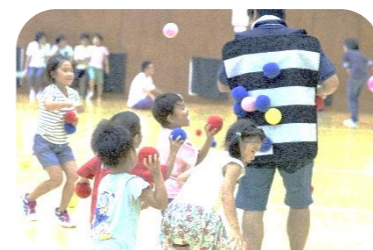
ペガーを遊ぶ子ども達

一番の魅力は、「成功体験ができる」こと。どんな障害があっても、身体動作に制限があっても、投げたボールが的にくっつくという小さな成功の