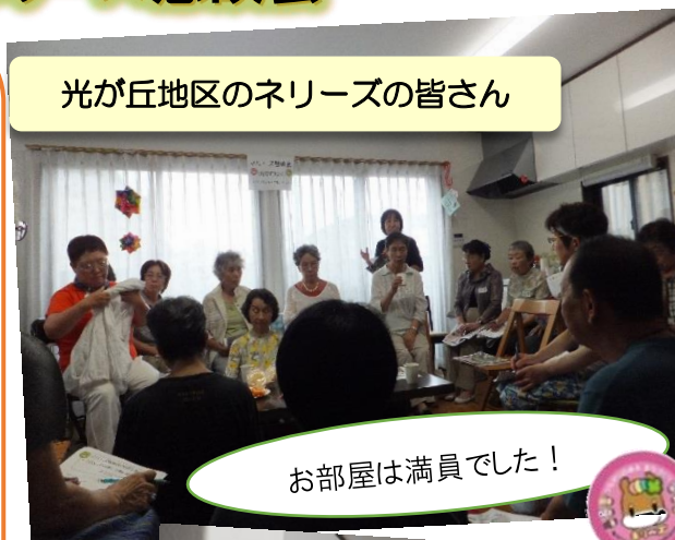
光が丘地区のネリーズの皆さん

つながりのある地域をつくるという意識を持つことが“ともに生きる”地域づくりにつながっていくことを共有できたひとときでした。