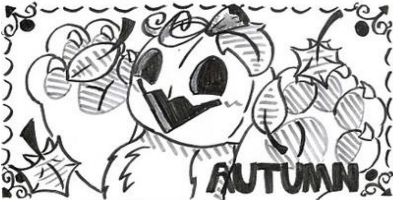
▲10月号のイラスト：ボランティアのすずなさんが描いてくださいました。

今回は、ボランティアの力を求めている福祉施設の皆さんから、「ボランティア活動をこれからしたい！すでにしている！」という地域の皆さんへのメッセージをお届けします。ぽけっとを読んでボランティアの秋を充実させましょう！