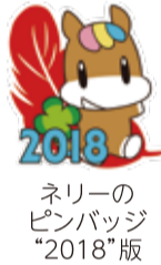
ネリーのピンバッジ“2018”版