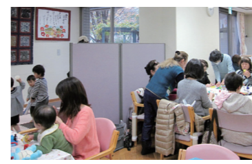
キッズスペースとプログラムの様子

「虹のカフェ大泉」は、「地域福祉パワーアップカレッジねりま」の10期生と「高齢者支え合いサポーター育成研修」の修了生が多世代で集う交流の場所を作るため、大泉特別養護老人ホームのデイサービスの食堂を借りて始めました。最初は高齢者が多く参加していましたが、子連れのお母さんも顔を出すようになり、今では、子ども・母親・高齢者の多世代が集う居場所となったそうです。