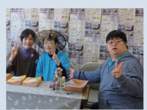
ボランティアさんと一緒にお客様をお迎えしました!

10月26日(土)に『白百合まつり』を開催しました。地域の方々やボランティアの皆さんのご協力により、多くの方々にご来場いただきました。アトラクション