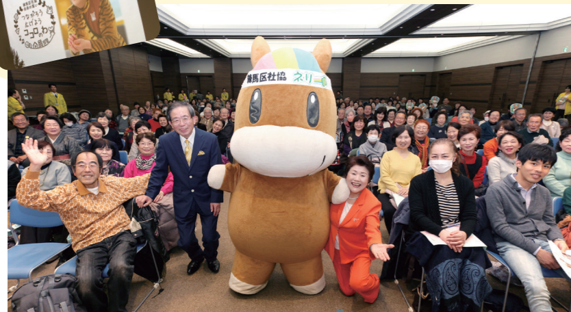
楽しく明るい雰囲気の中、会場が笑顔であふれました