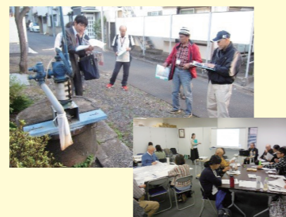
地域を知るために防災や福祉の視点でまちを実際に歩きました

災害時、練馬の地域で人と人をつなぐかけ橋になるために、地域、福祉、防災のこと等をまち歩きや講座を通して学びます。