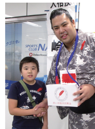
おすもうさんの手、大きいね!