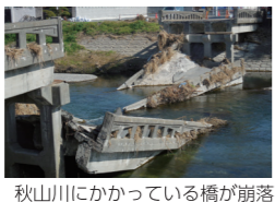
秋山川にかかっている橋が崩落

被災地の災害ボランティアセンターを全国の社協職員で応援するシステムが整ってきました。地域に出向いて皆さんの困りごとを聞きコーディネートするという社協の専門性が期待されているのだと思います。練馬区社協も千葉県鋸南町、栃木県佐野市へ5人の職員を派遣しました。下記は、初めて被災者支援に派遣された職員の感想です。