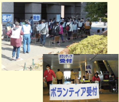
立ち上げ・運営訓練の様子

災害時、迅速に立ち上げるため地域住民や関係団体等と連携を深め毎年訓練を実施しています。