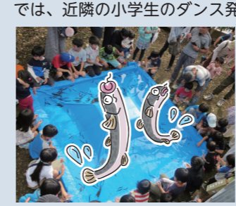
今年も"どじょうつかみ"大好評でした!!

では、近隣の小学生のダンス発表などで大いに盛り上がり、楽しいひとときとなりました。また、利用者による作業公開や自主製品の販売を身近でご覧いただける機会となり、祭りを通して皆さんと交流を深めることができました。