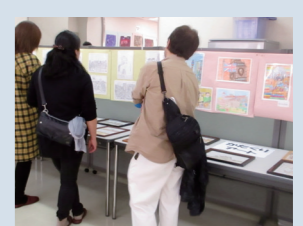
利用者の作品に見入っていました

11月9日(土)に、かたくり福祉作業所で『大泉☆かたくりギャラリー』を開催しました。