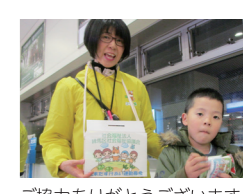
ご協力ありがとうございます!