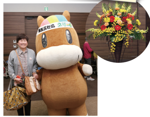
ネリーと一緒にパチリ!

練馬区社協では、これからも会員の皆さまに感謝の気持ちをこめたイベントを企画していきます!