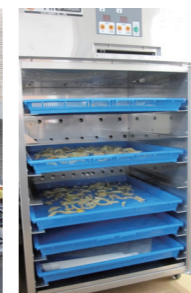
食材を乾燥させます