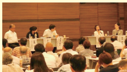
4名のシンポジストに話を聞きました

地域で様々な活動をしている方たちから、地域やご近所と関わりやつながりを持っていることについて話をしてもらい、災害時に助け合うために日頃からできることを一緒に考えます。