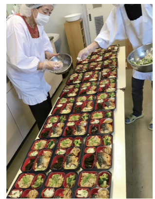
栄養バランスも考えられた彩どりの良いお弁当

「なのはな」は、毎週木曜日に近隣地域在住の高齢者等の見守りを兼ねた手作り弁当の配達を行っているボランティアグループです。1983年に高齢者給食調理ボランティアグループ「関石木曜会(せきしゃくもくようかい)」から出発しました。2001年に練馬区からの委託が終了した後も、地域の福祉は地域の人たちの協力でという主旨で「給食ボランティアグループなのはな」として活動しています。現在は13名の主婦の方たちが調理をし、20名の地域住民や民生・児童委員が戸別配達を行っています。