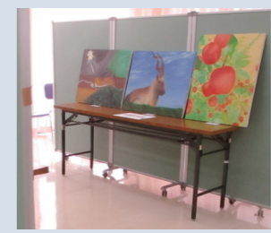
近隣の高校生の作品(油絵)

かたくりの利用者をはじめ、近隣の小学生や高校生、高齢者施設の利用者等、地域の方々の作品を展示しました。来場者の方からは「素敵な作品があつてびっくりです!」「あたたかい作品ばかりで素敵でした」等々の感想が聞かれました。一つひとつの作品との出会いにドキドキし、時間がゆっくりと流れていきました。