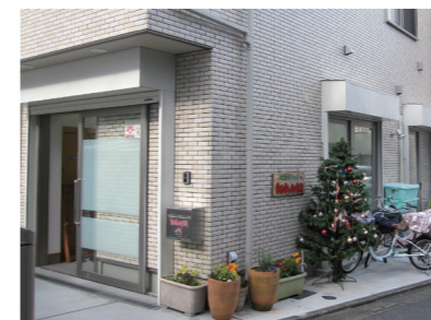
リニューアルしたトントゥハウス!

特定非営利活動法人 トントゥハウス 住所：練馬区東大泉 3-18-15 TEL：03-5387-1745