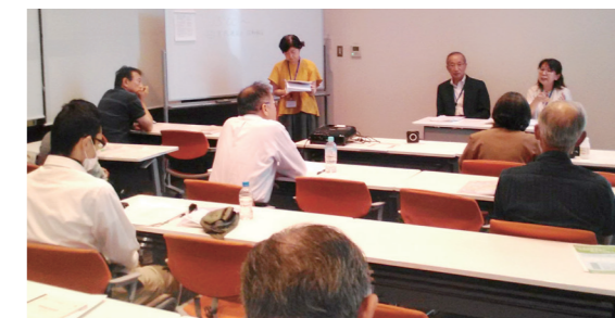
成年後見制度セミナーの様子

特定非営利活動法人 成年後見のぞみ会 住所：練馬区南大泉4-29-35 TEL：03-5387-5176