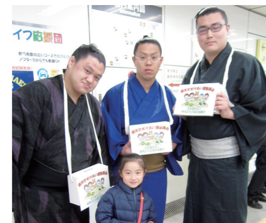
峰崎部屋のカ士の皆さんと

共同募金は、地域でともに暮らす人たちのために役立ててほしいという思いが込められた寄付金です。地域の町会・自治会、民生・児童委員の方や地域の商店街、そして駅での街頭募金とたくさんの方々にご参加、ご協力をいただきました。ありがとうございました。