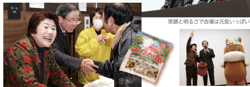
笑顔と明るさで会場は元気いっぱい!