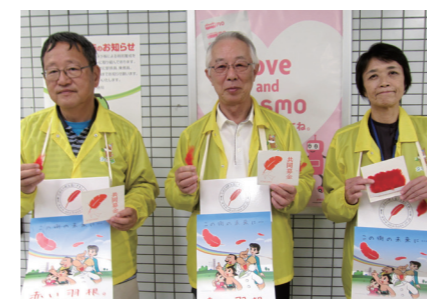
ニコニコ笑顔で呼びかけています!