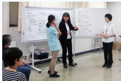
お母さんの子育てに対する不安解決のワンシーン

に探してみませんか。 【次回・地域向けSST連続講座】平成30年1月22日(月)、1月29日(月)、2月5日(月) 10:00～12:30 場所:豊玉障害者地域生活支援センターきらら 定員:20名 保育付き6名まで 問合せ・申込み:03-3557-9222