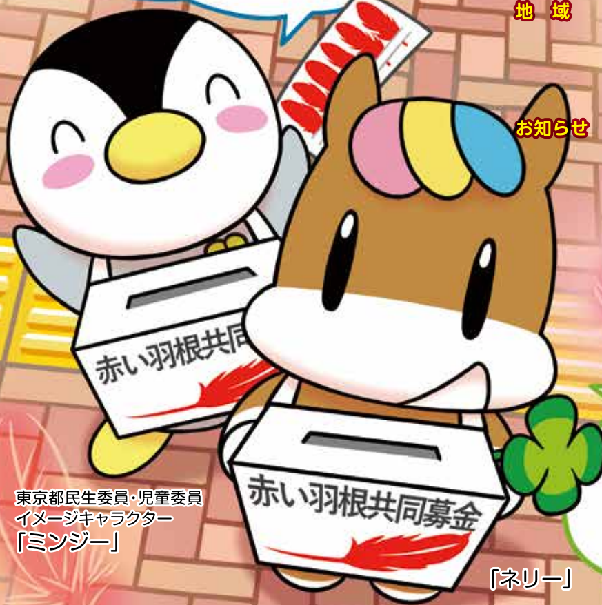
東京都民生委員・児童委員 イメージキャラクター 「ミンジー」