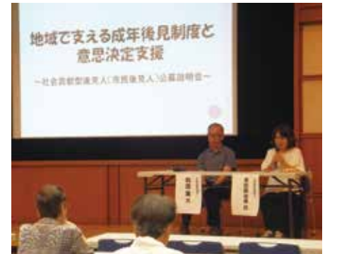
来年度も「社会貢献型後見人公募説明会」を実施します

権利擁護センター「ほっとサポートねりま」では、練馬区における成年後見制度の推進機関として、個別相談や制度説明会のほか、成年後見人等の支援を受けているご本人や成年後見人等になっているご親族の方が安心して制度を利用できるようサポートを行っています。また、同じ地域の生活者としての視点で後見業務を行う「社会貢献型後見人(市民後見人)」の養成と支援をしています。現在成年後見制度の利用を検討している方も、将来に備えて成年後見制度を知っておきたい方も、どうぞお気軽に「ほっとサポートねりま」までご相談ください。