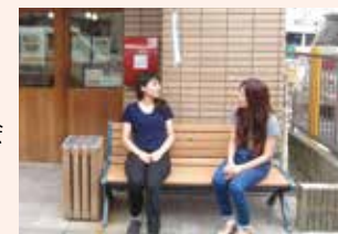
お店の前に新しいベンチを設置しました

ベンチはすのうべる利用者が一息つく場所として活用させていただいております。また、それだけではなく地域の方とのコミュニケーションを交わす場となり、これからも地域交流の場となることを期待し活用させていただきます。