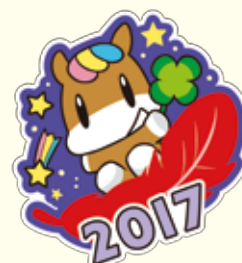
ネリーのピンバッジ“2017”版