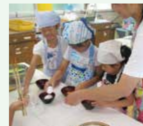
ホットプレートで目玉焼き。上手に割れるかな？

今年度2回目のごはんをつくろう！は「もしもの時のために」をテーマに非常食を使ったごはんづくりをしました。いざという時に家にあるもので対応できるように今回はアルファ米や缶詰などを使っての体験。この経験を通して災害時やもしもの時に対する子どもたちの生きる力を高めていきたいと願っております。