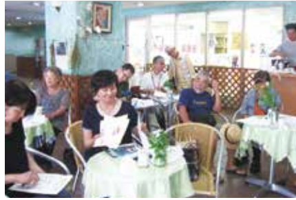
聖書キリスト教会内「喫茶カフェ」にて(練馬地区)

7月6日(木)に大泉地区で16名のネリーズが、会場となったはつらつセンター大泉の施設見学や情報交換を行いました。参加者から「出会いを大切に生活し、一人暮らしの高齢者への声かけなどで様々な出会いが広がっている」、「ネリーズの暮らしを見て、自分が日ごろ気にかけていることと同じだったので登録した」と、つながりが広がっている声がありました。また、8月3日(木)には練馬地区で25名のネリーズが集まり、懇談会を行いました。参加者からは地域で人とつながっていくことの大切さについて、「人との出会いで広がりが生まれる」、「地域にはいろいろな人がいることを認識することも大切。知ることで関われることもある」との意見があがりました。