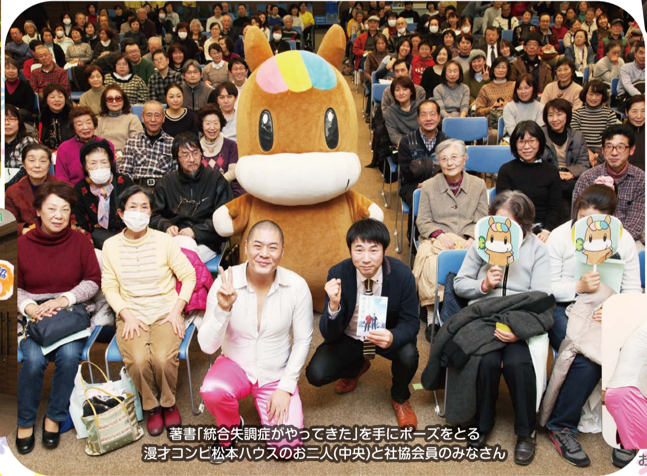
ネリーから会場のみなさんへご挨拶