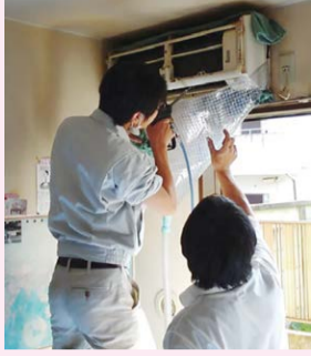
「購入したエアコン洗浄機は使い勝手がよく洗浄技術を身に付けた利用者が、就労につながりました」（あかねの会）

【前年度助成実績の一例】 社会福祉法人あかねの会 「就労継続A型事業所いろいろ」のエアコンクリーニング作業で使用する高圧洗浄機を助成金で購入しました。