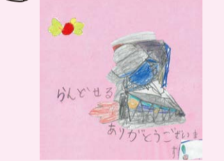
お礼のお手紙をいただきました

※募金の配分計画は、区内の様々な立場のみなさんで構成される「ねりま歳末たすけあい運動推進委員会」の審議を経て決定されます。