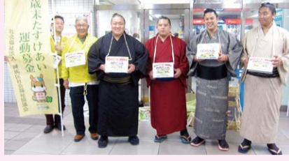
田柄 2 丁目にある峰崎部屋の力士のみなさんにもご協力いただきました

赤い羽根共同募金 金額 8,980,952 円 歳末たすけあい運動募金 金額 14,355,423 円