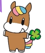
練馬区社協キャラクター ネリー

豊玉障害者地域生活支援センターきらら は、障害のある人たちやその家族が地域で 孤立せず、安心して自分らしくいきいきとした生活が送れるように一緒に考え、 サポートするところです。