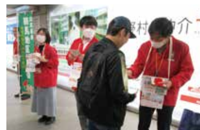
赤い羽根をお渡ししました

共同募金は、地域でともに暮らす人たちのために役立ててほしいという思いが込められた寄付金です。民間福祉施設の環境整備、子育て支援、障害者の自立支援のための事業のほか、私たち練馬区の地域福祉を推進していく事業費として配分されます。町会・自治会、民生・児童委員や商店街など、たくさんの方々にご参加、ご協力をいただきました。地域の方にもご参加いただき駅での街頭募金を実施しました。ご協力いただいたみなさま、ありがとうございました。