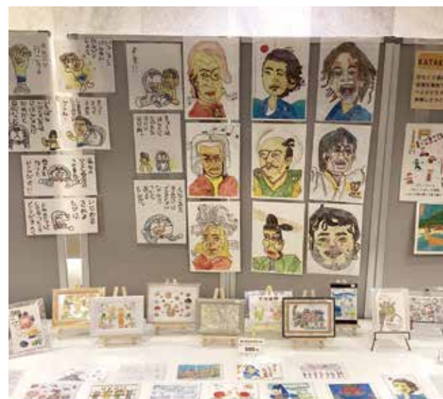
かたくりギャラリーin光が丘IMA 展示風景

この数年で世界的にも注目されるようになった、障害者アート作品をご覧になったことはありますか。かたくりでは、線を描く、色を塗る、文字を書くなど、一人ひとりの得意を活かし、カレンダー、ポストカード、ブックカバーを商品化し、販売しています。光が丘IMAで開催されているIMA寄席の公演前に販売会を行ったところ、来場された方からとても繊細な描写だとお褒めの言葉を頂きました。これからも様々な作品をより多くの方に知ってもらえるよう頑張っていきます!