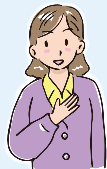
Aさん (民生・児童委員)

練馬区社会福祉協議会では、ひとりの不幸も見逃さない〜つながりのある地域をつくる〜という理念のもと、日々様々な相談を受けています。住民のみなさんから地域の気になることや困りごとも多く寄せられています。今回は、その相談の一部を紹介します。