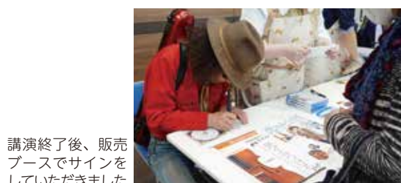
講演終了後、販売ブースでサインをしていただきました