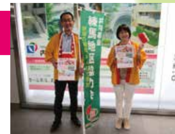
練馬駅での街頭募金

赤い羽根共同募金 6,236,366 円 歳末たすけあい運動募金 9,030,526 円