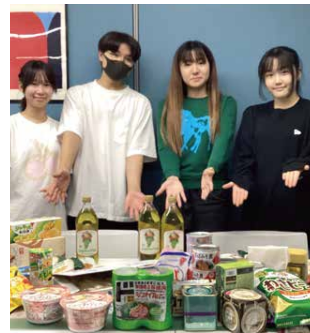
生活サポートセンターに寄付していただきました

主に学校内でフードドライブを行い、近くの食料支援団体に寄付をしたり、子ども食堂での活動(お皿洗いや配膳、子どもたちとの交流)を行っています。立ち上げた先輩たちの思いを後輩へ引き継ぎながら活動しています。2022年に練馬区社協生活サポートセンターとつながり、いつも食料品がいっぱい詰まったスーツケースを、電車に乗って届けてくださっています。