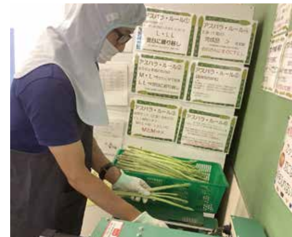
アスパラの選別作業

練馬区社会福祉協議会の各部署の事業活動をみなさんにわかりやすくご紹介するコーナーです。