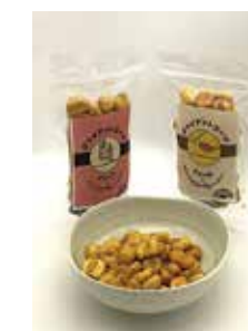
製品名: ジャイアントコーン フレーバー2種: アスパラベーコン、アスパラピンクソルト

作業の一環として白石農園からアスパラの仕分け、袋詰め、梱包、発送作業を委託されています。アスパラを仕分けする際に長さをそろえるため、根元の部分を機械で切り落とし、廃棄をしていました。何かに活かせないかと考え、日頃から工賃向上、販路拡大などでコンサルティングをいただいている(株)コレノさんと共同で、廃棄するアスパラの根元の部分を粉末にして味をつけたジャイアントコーンを作りました。商品ラベルの貼り付けとイラストデザインはかたくりの利用者が行い、購入していただいた方からは「イラストがきれい」「美味しい」という声をいただき、利用者の励みになっています。ぜひ一度お買い求めください。