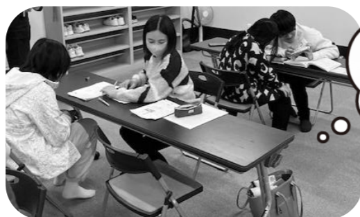
▲こどもにほんごクラス 活動の様子

ボランティア活動が自分の『居場所』にもなり得ること、活動を通して新しいつながりができる楽しさを伝えたいです。 日本語教室のボランティアをきっかけに、最近は他の活動にも参加しています。活動を通じ、 自分の知らなかったことに出会えるのは本当に楽しいです！