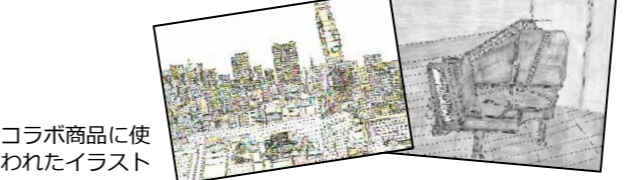
コラボ商品に使われたイラスト

身近な会社やお店が地域のことに力を貸してくださるのは、本当に心強いです。社会貢献に関心のある企業の方も、企業の力を借りたい施設・団体の方も、まずはお気軽にお問合せください!