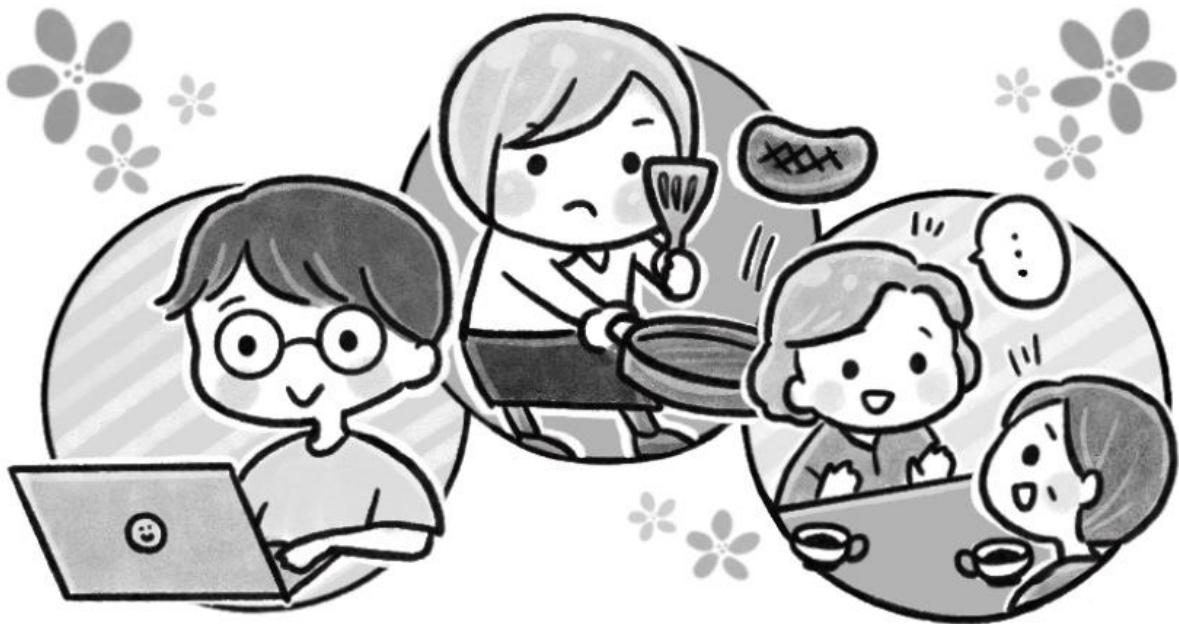
▲4月号のイラスト：ボランティアの maffy さんが描いてくださいました。

今月のぽけっとでは、改めて練馬ボランティア・地域福祉推進センターについて、どのような相談ができるのかを特集しています。わたしたちのことをより身近に感じていただければと思います。